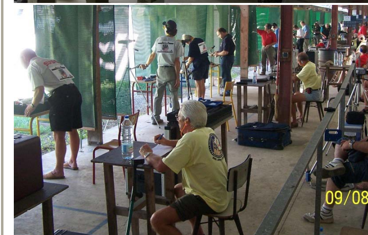
Francia 2006. Los secretarios de puesto (camiseta amarilla) en su misión de controlar los disparos de los participantes.