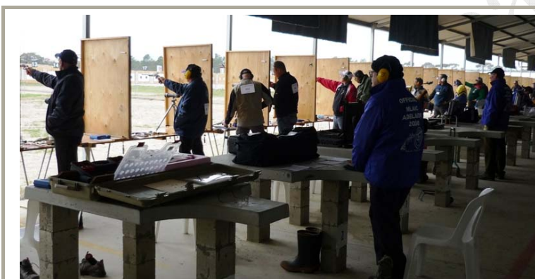
Australia 2008. Se aprecian los secretarios de puesto (chaqueta azul) atentos tras los participantes.

El Director de la tirada es el responsable del buen funcionamiento del campeonato, tanto en lo deportivo como en la gestión de los servicios auxiliares asociados.